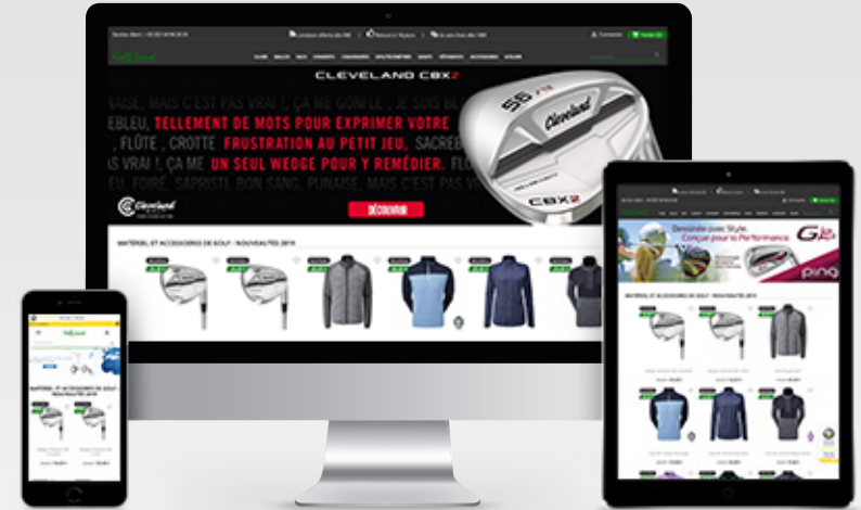
Golf Land Vente de matériel de golf https://golf-land.fr