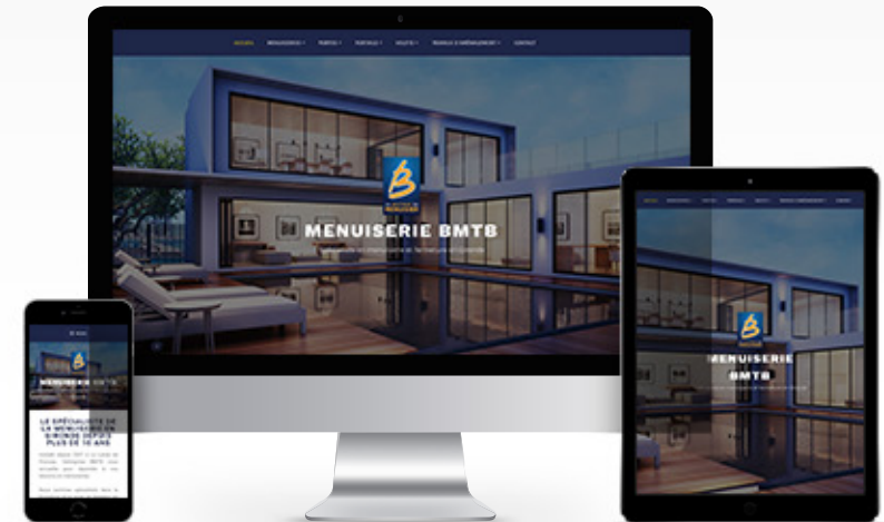
La Boutique du Menuisier - BMTB SARL Menuiserie & Fermeture « en cours de réalisation »