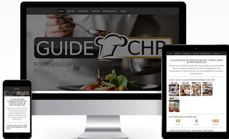
Guide CHR Presse professionnelle https://guide-chr.fr